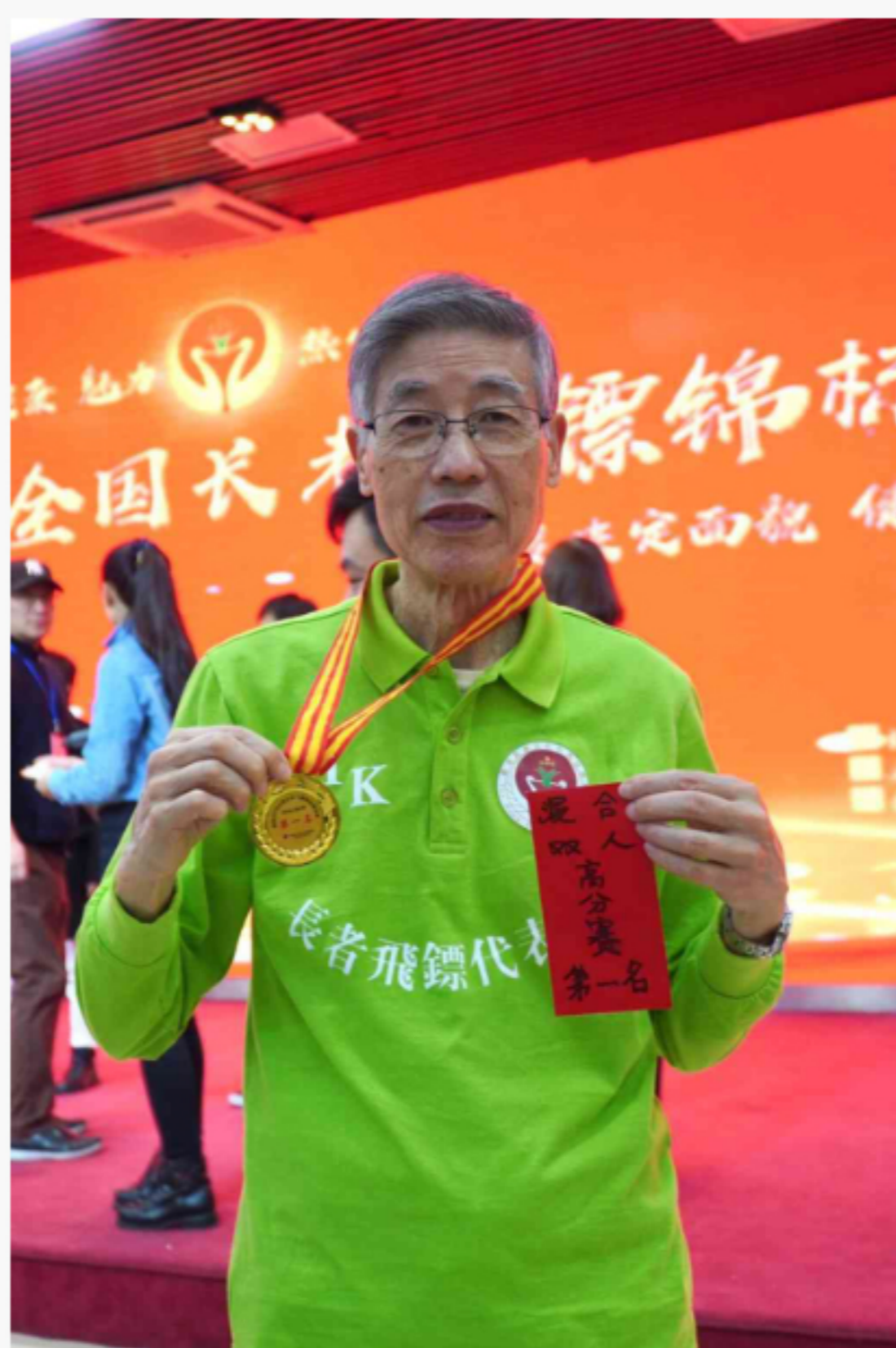
Sam哥代表香港參加《第一屆全國長者飛鏢錦標賽》，獲得混雙冠軍，為港增光。

無奈資源不足，Sam哥無法廣泛地推廣這項活動給長者，「需求很大，但興趣班的名額不足以應付需求，導致收生名額很快爆滿，很多感興趣的長者都無辦法成功申請。」他表示希望相關機構能夠提供資源，讓更多長者能夠受惠。除此之外，Sam哥還打算向長者推廣飛鏢的樂趣。兩年前，他為了可以參加《第一屆全國長者飛鏢錦標賽》，不停自學飛鏢，最後勝出選拔賽，代表香港到北京參加混雙項目，還獲得了冠軍殊榮。為了好好利用他在飛鏢方面的知識，他也打算在社福機構教授長者。此外，他亦是「賽馬會齡活城市計劃」的齡活大使，協助向市民大眾推廣長者及年齡友善訊息。