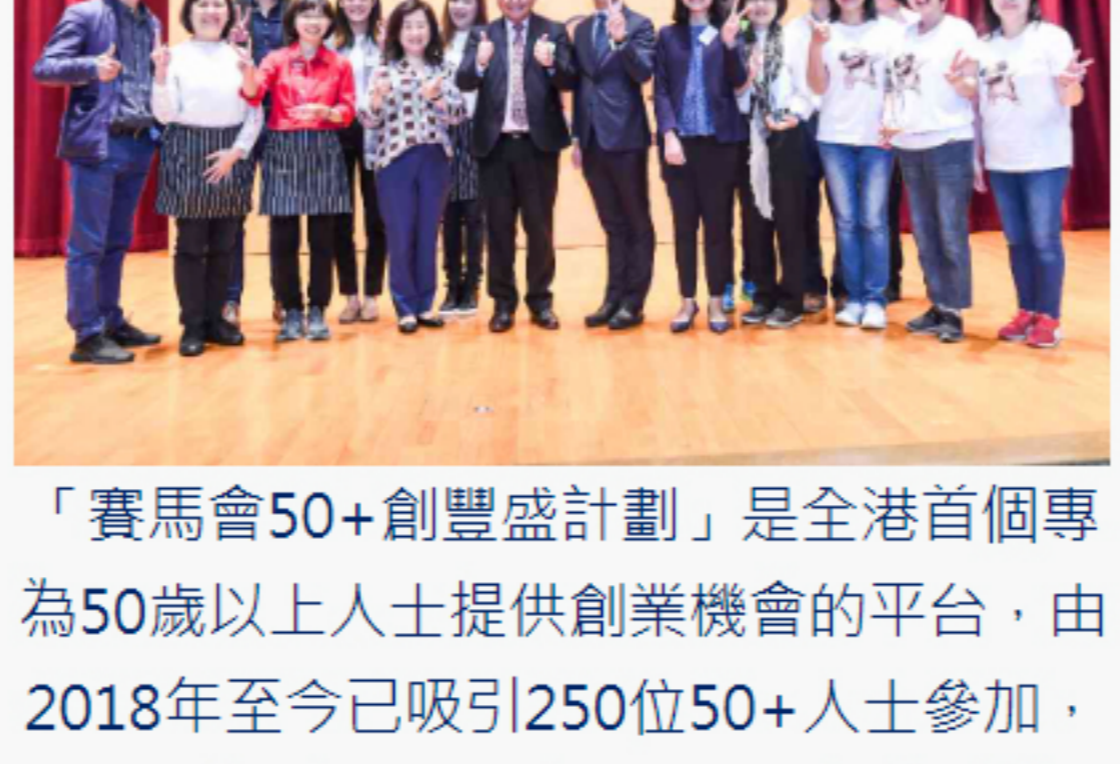
「賽馬會50+創豐盛計劃」是全港首個專為50歲以上人士提供創業機會的平台，由2018年至今已吸引250位50+人士參加，並服務超過2,000名人次。(攝於疫情前)

其中一個得獎隊伍是「日日有聲」團隊，他們關注吞嚥困難患者及病患照顧者，推動吞嚥健康教育及共融營養軟餐；另一個得獎隊伍則是「同行有我」團隊，他們針對獨居及「雙老戶」長者提供「陪行服務」，結合步行減壓和聆聽及情緒支援；還有「首智新天地」團隊，為長者度身訂造IT課程，包括學習電子支付、手機編程等，讓長者跟上時代步伐。