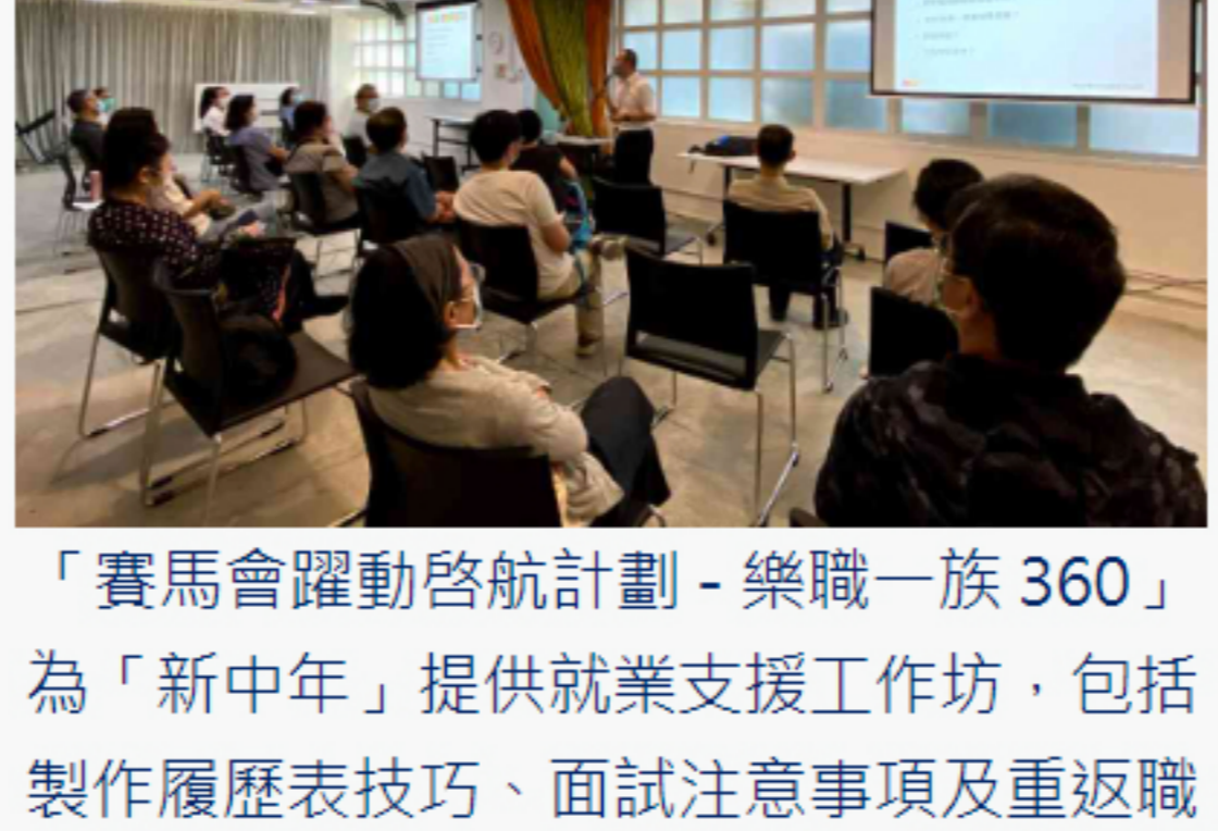
「賽馬會躍動啟航計劃-樂職一族360」為「新中年」提供就業支援工作坊及重返職場製作履歷表技巧、面試支援事項及重返職場與後生仔溝通的竅門等。(攝於疫情前)

除了工作配對平台，計劃亦包含「樂職顧問」服務，由一班「新中年」為年輕人提供職涯諮詢及建議。「不少年青人對前景感到迷惘，需要有經驗人士提供行業意見、解答職場問題。透過一對一的對談，不但年青人有所得益，『新中年』亦可傳承技能及知識，並拉近與新一代的距離，加強共融溝通。」