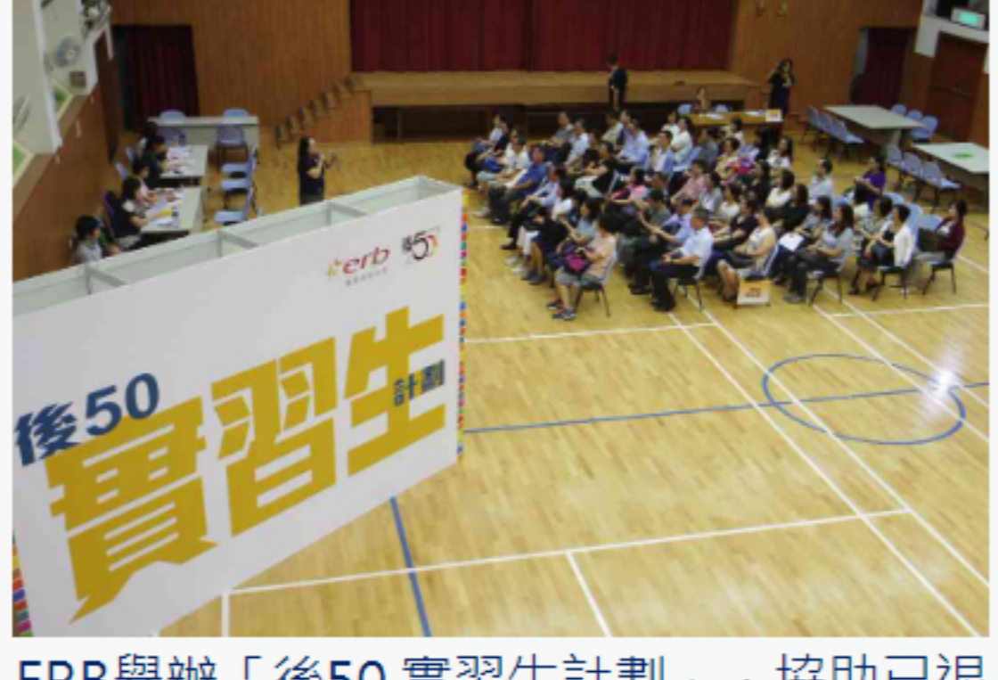
ERB舉辦「後50」實習生計劃，協助已退休但仍有就業意欲的「後50」裝備技能和調整心態，以重返職場，同時推動企業聘用「後50」。(攝於疫情前)

余主席以「後50」實習生計劃為例，兩期計劃共有約80間機構參與，涵蓋約20個行業，包括公共事業、金融財務、會計、社會服務、物業管理及保安、製造業等。僱主對實習生的表現給予十分正面的評價，有三成實習生在完成實習後更獲聘用為正式員工。此外，ERB一直為「後50」提供專設課程，協助他們投身能配合個人特質的相關工作，及推出「先聘用、後培訓」計劃、「度身訂造課程」等特別培訓計劃。